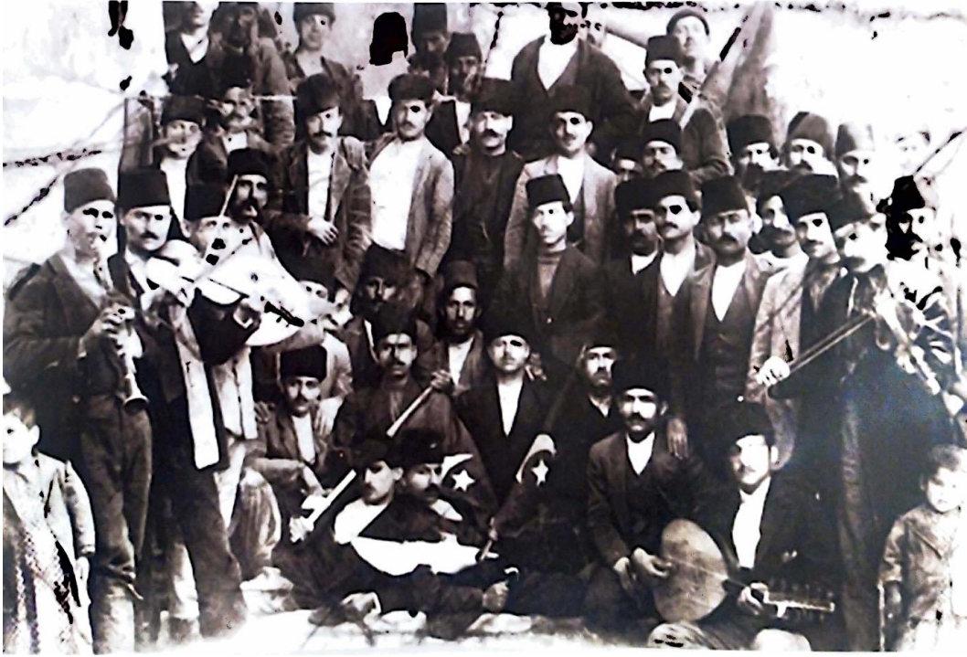
Resim 4: Talas'ta yaşayan Türk, Ermeni ve Rumlar II. Meşrutiyetin 1. yıldönümü kutlamalarında (1909)

Kayseri ve civarındaki halkın 19.yy. daki demografik profili ve sosyoekonomik durumu dikkate alındığında Amerikalı misyonerler bölgede yaptıkları faaliyetlerle her biri birbirine eklenmiş ve birbiri içine geçmiş çeşitli dini, siyasi ve kültürel kazanımlar hedeflemiştir. Bunların belli başlıları aşağıdaki gibi sıralanabilir: