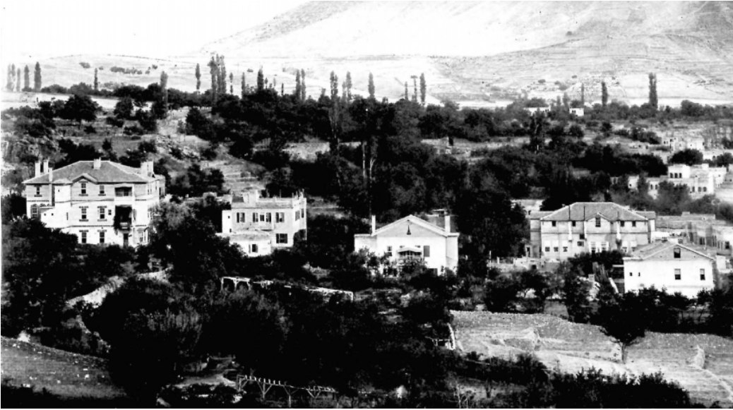
Resim 3. Okulun ilk yılları (soldan sağa) Amerikan Hastanesi, Lojmanlar ve Kız Okulu.