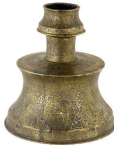
Şamdan, 13. yy, Anadolu (Benaki M.)