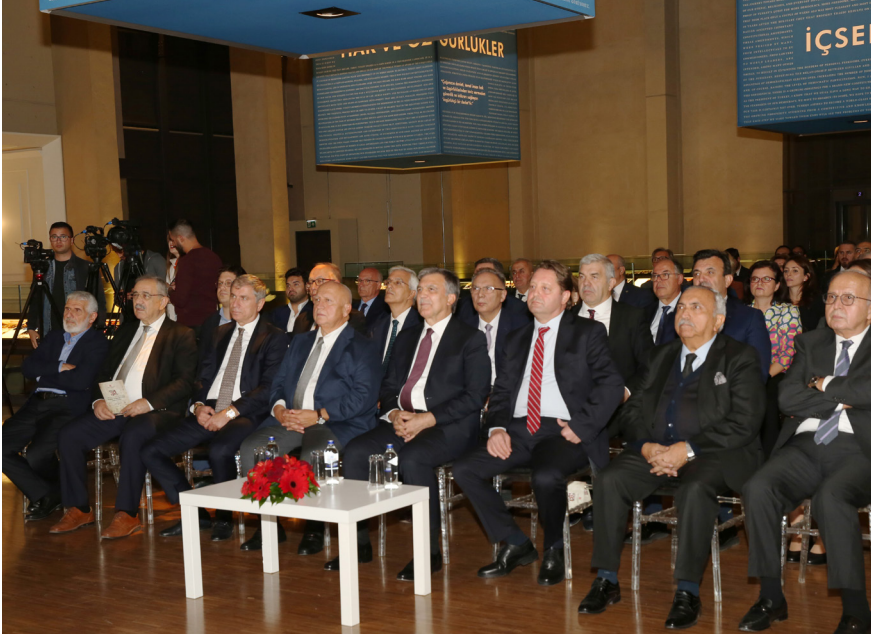
Açılış Resepsiyonu Klasik Türk Müziği konserini izleyen davetliler