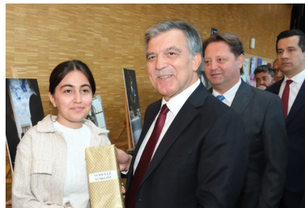
Cumhuriyet Temalı Fotoğraf Yarışması

Dereceye girenler ödülleri 11. Cumhurbaşkanı Gül'den aldı