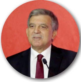
Abdullah Gül Türkiye Cumhuriyeti 11. Cumhurbaşkanı

D eğerli Konuklar, İsmimi taşıyan üniversite olan AGÜ'nün düzenlediği “Cumhuriyet’in Yüzüncü Yılı” etkinliğinde siz değerli katılımcılar ile beraber olmaktan büyük mutluluk duyuyorum.