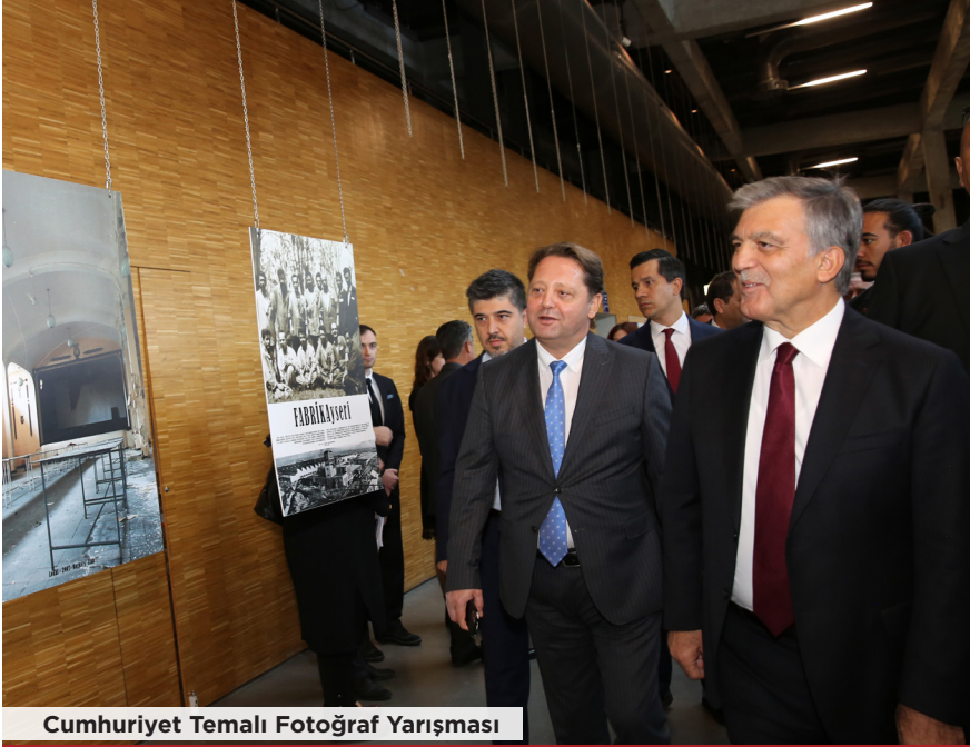
Cumhuriyet Temalı Fotoğraf Yarışması

11. Cumhurbaşkanı Gül, yarışmaya katılan eserleri inceledi