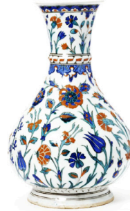
Çini Vazo, İznik, 1575, (Victoria and Albert M.)