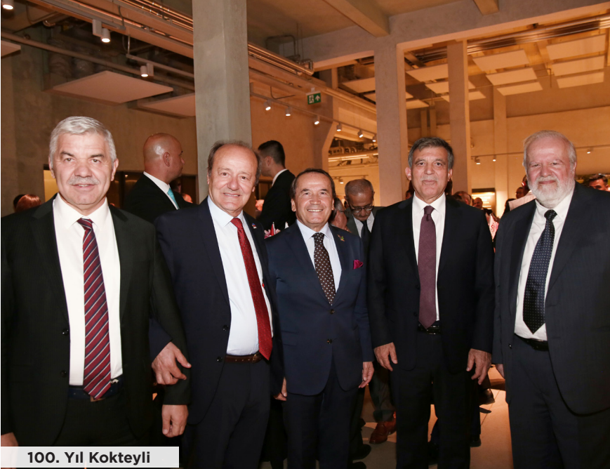
100. Yıl Kokteyli

Sergide farklı sanatçıların resim, fotoğraf ve heykel gibi eserleri sergilendi