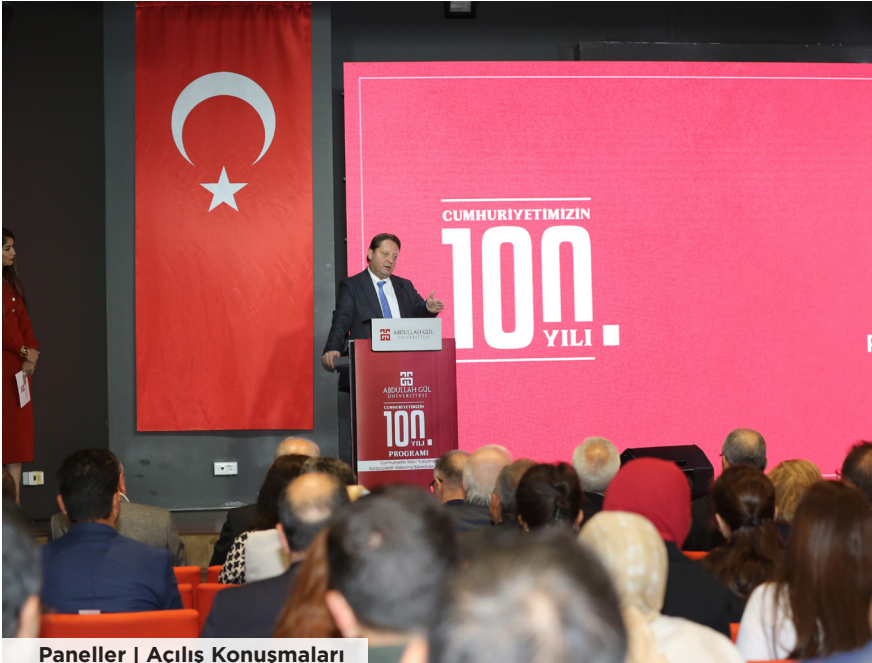
Paneller | Açılış Konuşmaları

Cumhuriyet'imizin 100. Yılı Panelleri, açılış seremonisiyle başladı