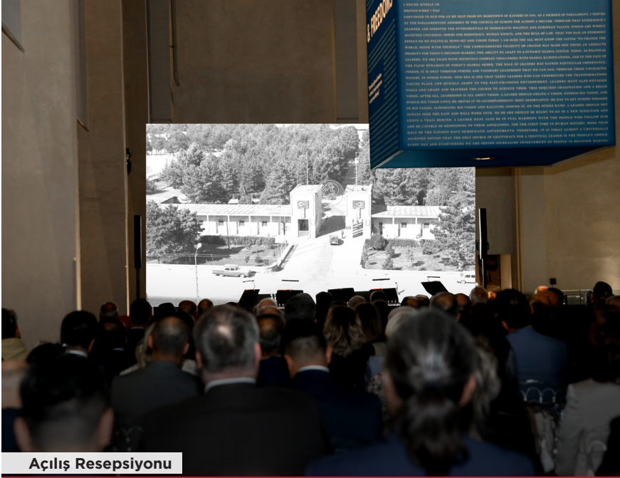
Açılış Resepsiyonu Sümerbank Bez Fabrikası konulu belgesel gösterimi