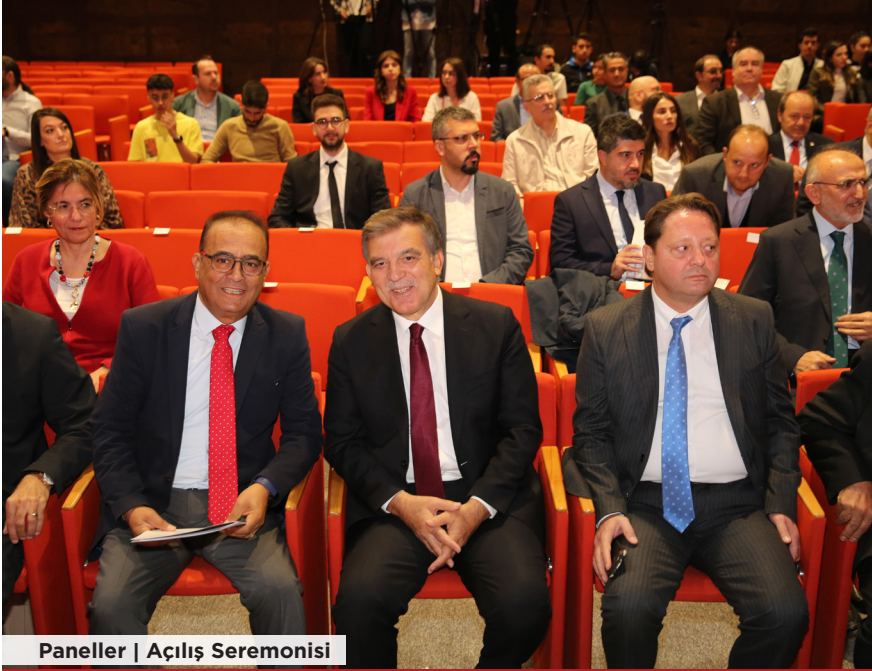
Paneller | Açılış Seremonisi

Cumhuriyet'imizin 100. Yılı Panelleri, açılış seremonisiyle başladı