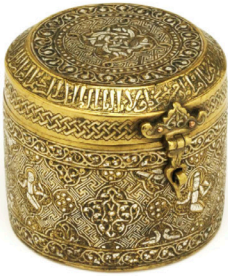
Pirinç Kap, 13. yy, Musul (British M.)

Öncelikle, bu yazıda kullanılacak üç adet objeyi tanıtarak başlamak yararlı olacak. Altta solda, Musul hükümdarı Atabey Bedreddin Lülü (1233-59) adına yapılan gümüş kakmalı kapaklı bir pirinç kap yer alıyor. Ortada, Anadolu Selçuklularına ait on üçüncü yüzyıla tarihlenen gümüş kakmalı bir pirinç şamdan bulunmaktadır. Sağda ise on altıncı yüzyıldan bir Osmanlı yapımı çini vazo var.